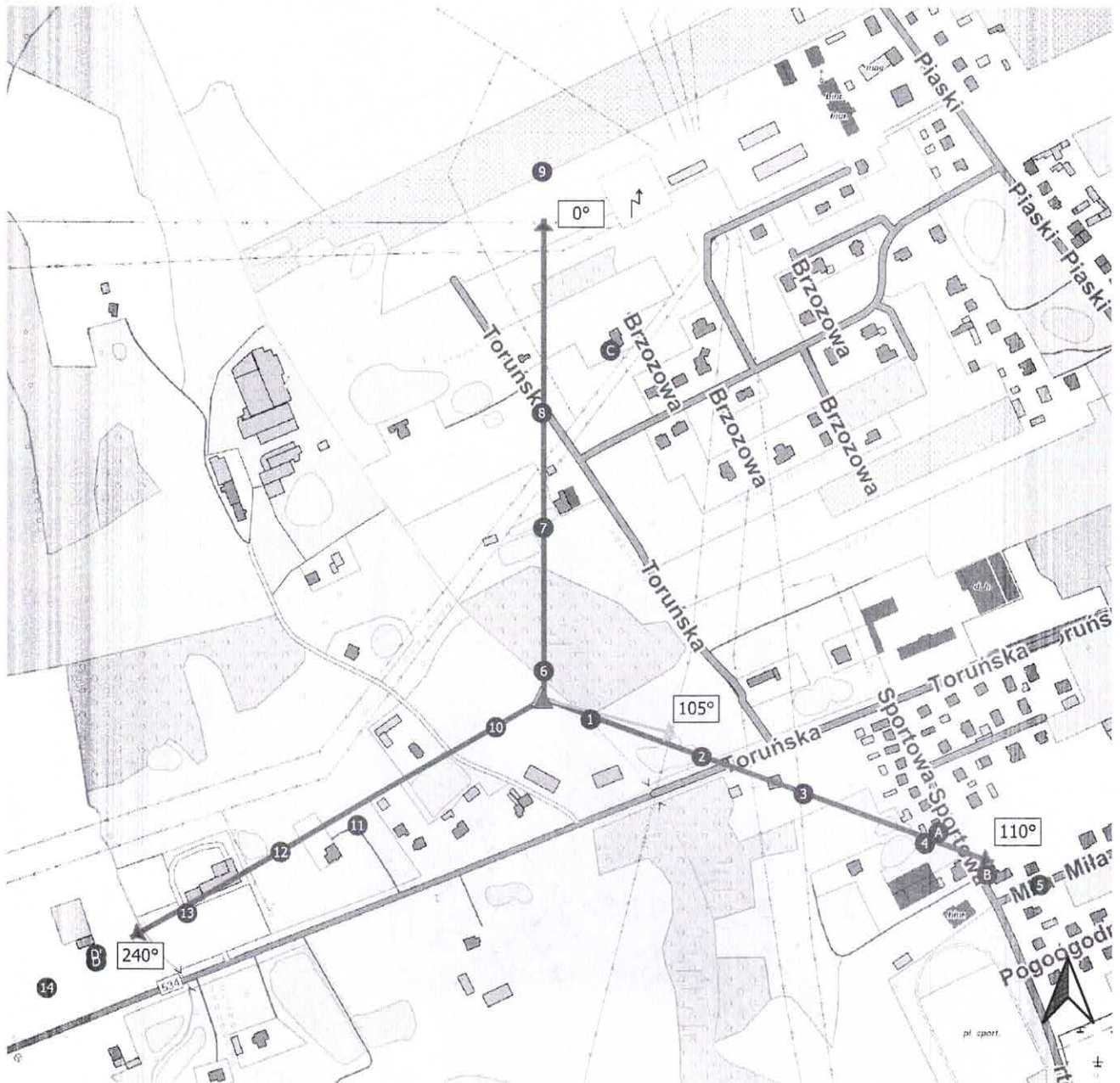
Załącznik 2. Widok pionów pomiarowych