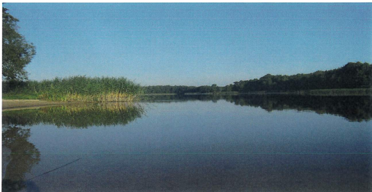
Rysunek 8 Jezioro Łąkie