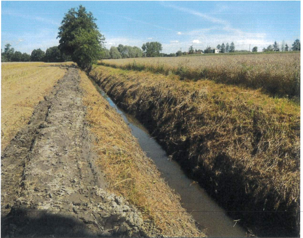
Rysunek 4 Rzeka Młynarka