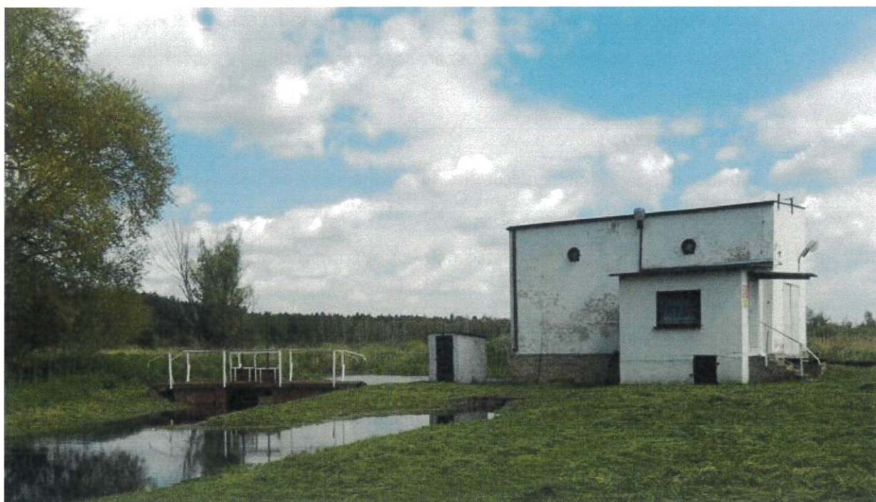
Rysunek 1 Budynek stacji pomp Wólka - Mień