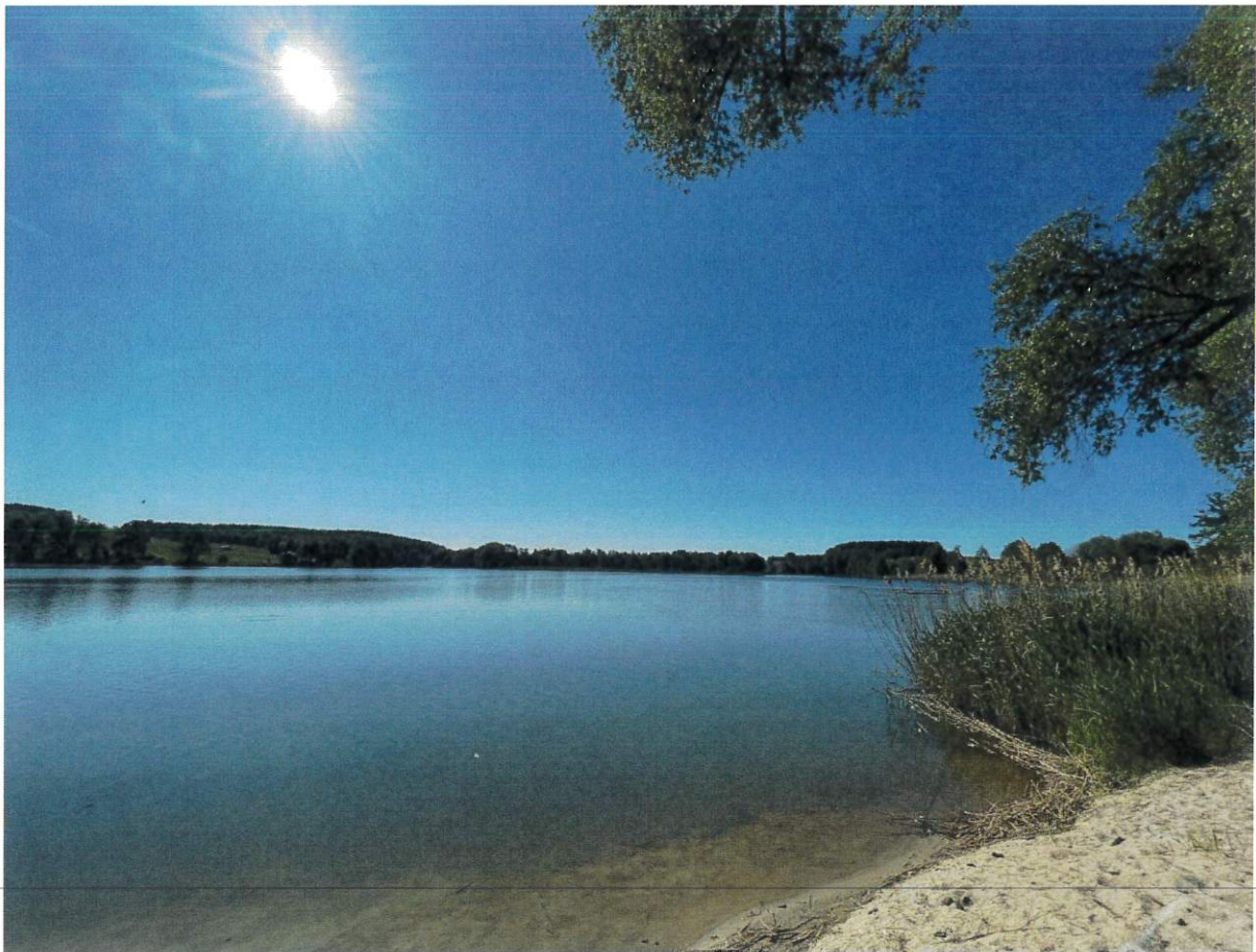
Rysunek 10 Jezioro Konotopie