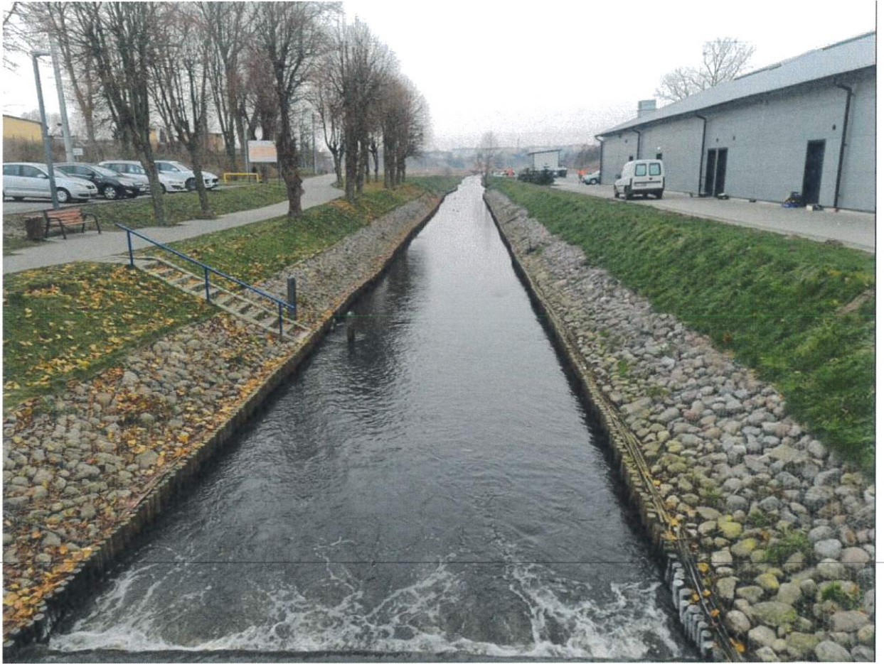
Rysunek 2 Rzeka Mieć - m. Lipno