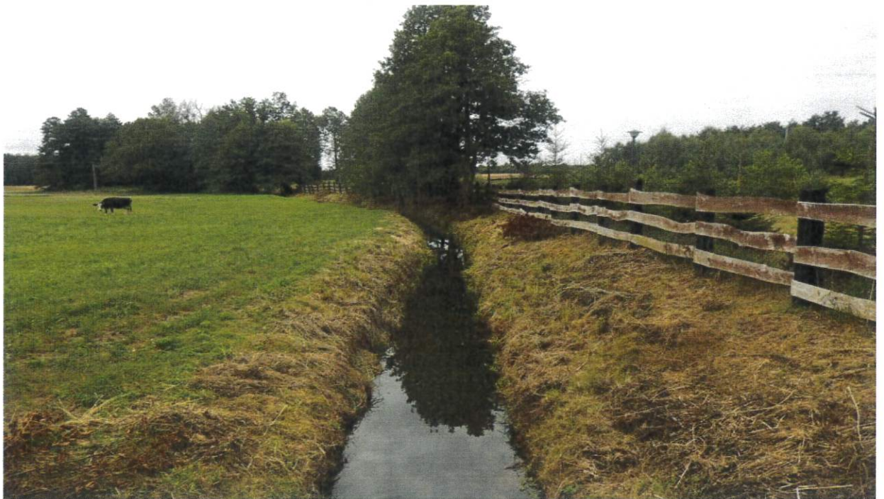
Rysunek 5 Rzeka Kanał Łąkie