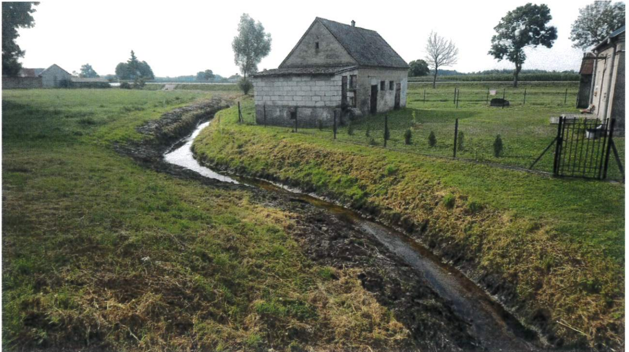
Rysunek 3 Rzeka Mieć - m. Blinno