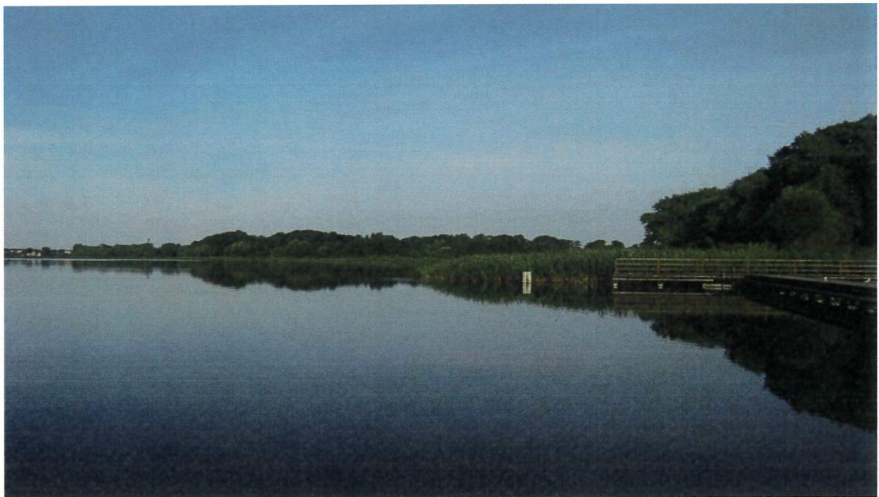
Rysunek 7 Jezioro Skępskie Wielkie