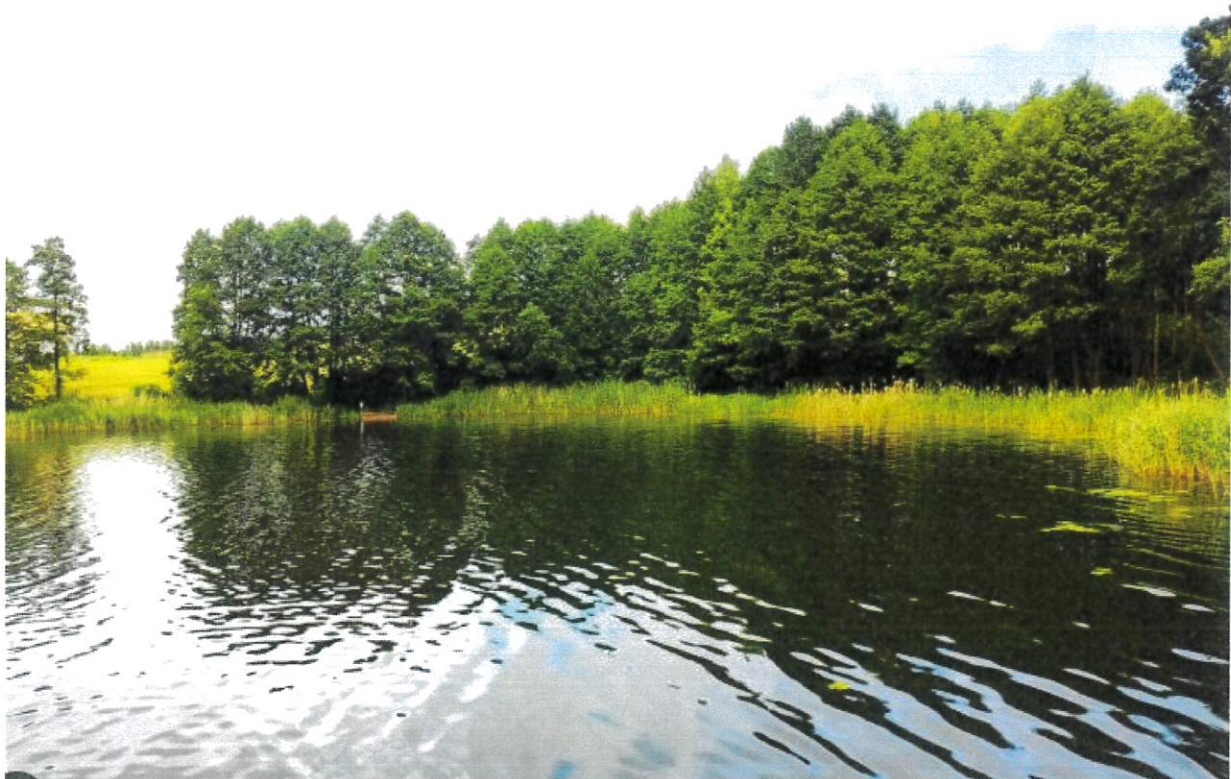
Rysunek 11 Jezioro Lubówiec