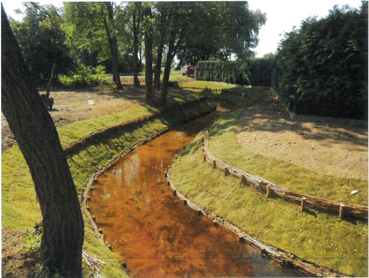
Rysunek 6 Rzeka Biskupianka